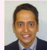
委員 ガイレルパク 本場インド料理店 ルバ 飲食業