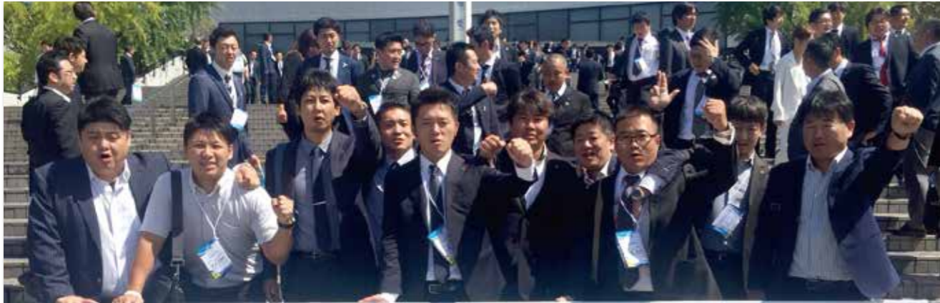
九州ブロック大会 佐賀大会